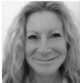
Figure importante de la littérature fantastique, elle est surtout connue pour ses écrits noirs à l'imaginaire débridé. Depuis une vingtaine d'années, elle a publié trois romans, L'Ange écarlate , L'Eau noire et L'Ombre pourpre (la trilogie Les Cités intérieures ), de nombreuses nouvelles, courts récits et quelques poèmes. Elle travaille sur Le Deuxième gant , son prochain roman, encore plus noir...