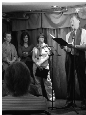
Cabaret littéraire 2009

Les membres peuvent soumettre des textes pour les projets et publications de la Fédération :