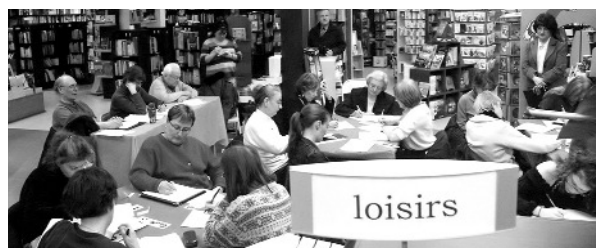
Marathon d'écriture, tenu à la librairie Alire de Longueuil (mars 2008)

NOUVEAU .....Fin de semaine d'écriture... dans la nature p. 7