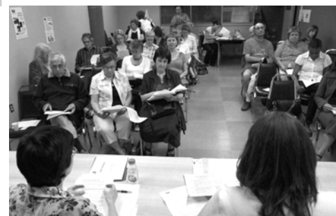
Assemblée générale des membres (12 juin 2008)