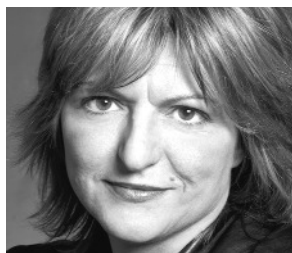
Figure importante de la littérature fantastique, elle est surtout connue pour ses écrits noirs à l'imaginaire débridé. Depuis une vingtaine d'années, elle a publié trois romans, L'Ange écarlate , L'Eau noire et L'Ombre pourpre (la trilogie Les Cités intérieures ), de nombreuses nouvelles, courts récits et quelques poèmes. Elle travaille actuellement sur Le Deuxième gant , son prochain roman, encore plus noir...