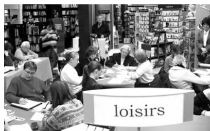
Marathon d'écriture, tenu à la librairie Alire